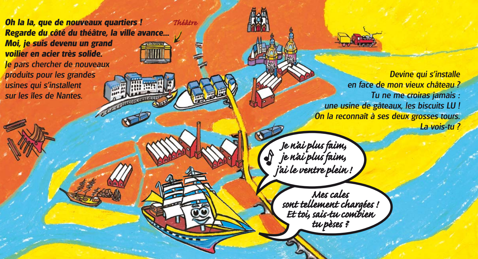
planche XIX ème